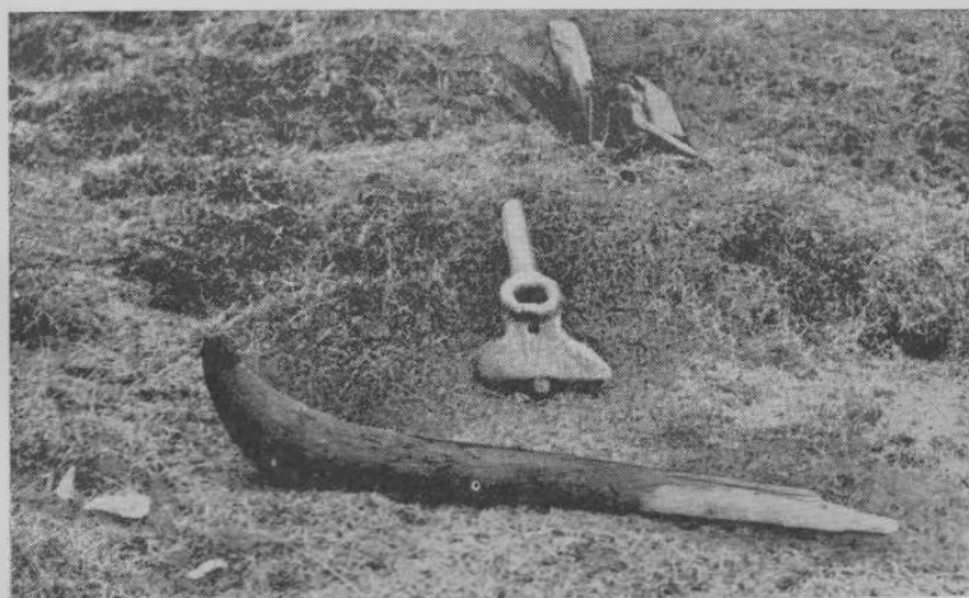
Рис. 2. Детали старинных нарт, найденные на месте зимовья Н. Фомина

ган». В 40-х гг. XVIII в. это была самая дальняя от устья Пясины постройка на севере 4 . Развалины этих поселений сохранились до сих пор.