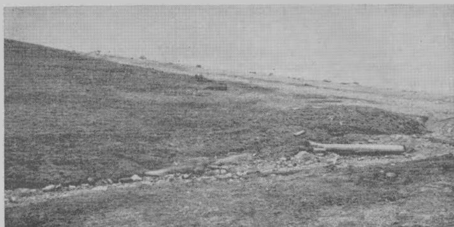
Рис. 1. Место городища зимовья Н. Фомина