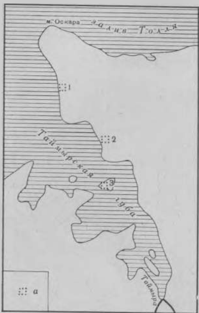
Рис. 3. Местонахождение развалин поселений XVIII в. в р-не Таймырской губы: а — развалины зимовий; 1 — остатки сруба (2,5×6,5 м), впервые обнаруженного в 1915 г. экспедицией Б. А. Вилькицкого; 2 — городище зимовья Н. Фомина, найденное в 1972 г.; 3 — развалины постройки (2,5×3 м), обнаруженной в 1843 г. А. Ф. Миддендорфом

По путевому журналу Х. Лаптева (1741 г.) можно восстановить место нахождения зимовья «новокрещенного якута» Никифора Фомина 9 на Таймырской губе, построенного за 7 лет до посещения этих мест Х. Лаптевым 10 . В журнале содержатся сведения о том, что якут Н. Фомин выехал на промысел на 80 верст к северу от устья реки Таймыры, пере-