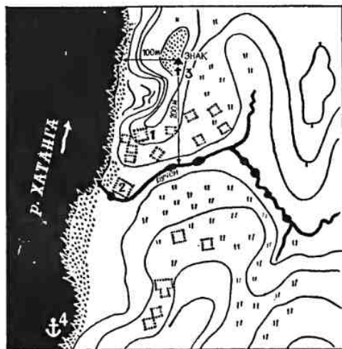
Схема пеленгования с дубель-шлюпки «Якутск» мыса Высокий у реки Блудная и зимовья. 13 июля 1740 года.

Проверить эти сведения Х. П. Лаптев послал штурмана Челюскина... Спустя 3 часа «посланной на ялботе штурман Челюскин