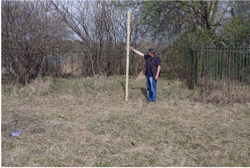
Рис. 5. Участок южной стороны платформы – вероятно, засыпанный ров (снято с ЮВ) Fig. 5. The site on the south side of the platform is probably a covered moat (filmed from SE)

в остроге от Я. О. Тухачевского новому воеводе И. Кобыльскому, одна из башен первого Ачинского острога называлась именно Боровой (Rezun, 1984: 83–84). Выявленные нами остатки рвов и земляных валов, насыпавшихся, как и положено, на внутреннюю сторону, также похожи на таковые в русских острогах. Наконец, если это действительно остатки первого Ачинского острога, то и его размеры приблизительно соответствуют численности отряда Я. О. Тухачевского, составившего затем первый гарнизон крепости – не более 40 чел. (Rezun, 1984: 76).