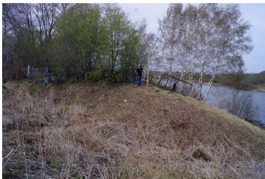
Рис. 4. Восточный ров (овраг?) (снято с СВ) Fig. 4. East moat (ravine?) (filmed from NE)

водоема, на самом возвышенном месте во избежание затопления во время наводнений, с учетом использования фортификационных особенностей местности (крутого берега или оврага). Поблизости от места строительства острога должен быть строительный