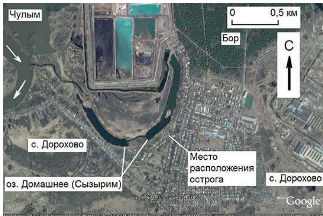
Рис. 2. Озеро Домашнее, бывшее Сызырим Fig. 2. Domashnee Lake, former Syzyrim

чине здесь нет какой-либо современной застройки. С восточной, южной и западной сторон поверхность у озера заметно выше и здесь вплотную к его берегам подступают усадьбы жителей с. Дорохово. Не занят постройками и огородами лишь небольшой участок средней части южного берега озера, где расположено местное кладбище, ныне не действующее. Оно целиком занимает уплощенную земляную трапециевидную платформу, отличающуюся от остальной поверхности южного берега своей возвышенностью – разница в высоте достигает 2 м.