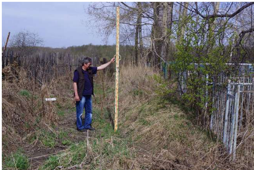
Рис. 3. Участок западных рва и вала острога (снято с ЮВ) Fig. 3. Section of the western moat and rampart of the «ostrog» (filmed from SE)