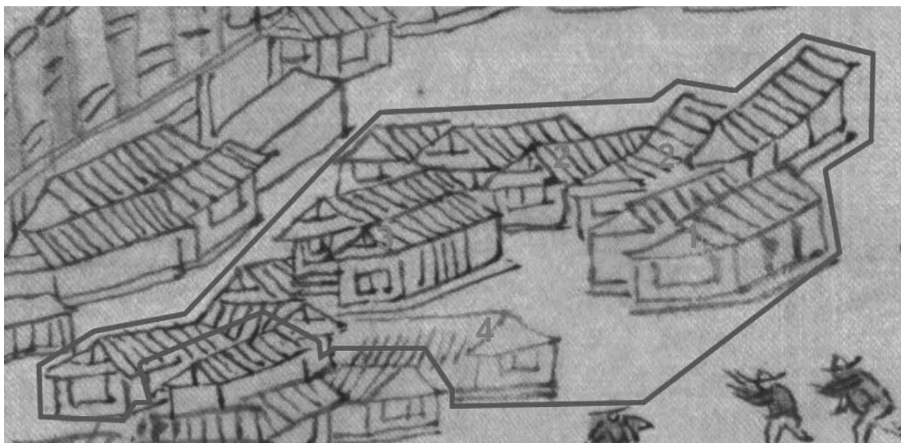
Рис. 4. Фрагмент рисунка «Luosha» из рукописного атласа «Aihun, Luosha, Taiwan, NeiMenggut» (艾渾, 羅刹, 台灣, 蒙古圖) с выделенными строениями, которые можно отнести к строениям приказной избы. 1 – Приказная изба; 2 – пушечный или оружейный амбар; 3 – пороховые погреба; 4 – сараи для хранения сельхоз инвентаря.