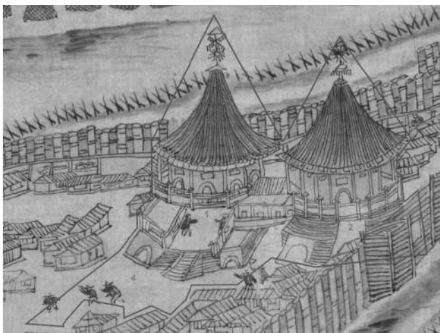
Рис. 2. Фрагмент рисунка «Luosha» из рукописного атласа «Aihun, Luosha, Taiwan, NeiMenggutu» (艾渾, 羅刹, 台灣, 蒙古圖) с выделенными строениями, которые можно отнести к Церкви «во имя Воскресения Христова» и городской площади. 1 – Церковь «во имя Воскресения Христова»; 2 – Переход, соединяющий церковь и колокольню; 3 – «Круглая» башня с надстроенной колокольней; 4 – Городская площадь.

выше подготовка к ее строительству, вероятно, началась уже в 1674 году и материалы необходимые для ее строительства хранились в Воскресенском амбаре. Построена церковь была за пределами малого острога. Об этом мы находим указание в «Книге ...»: «Да в том же новом остроге церковь во имя Воскресения г(о)с(по) да б(о)га и спаса нашего И(су)СА Хр(и)ста [15, л. 414]. Более точно локализовать местоположение церкви позволило обнаружение Албазинской Археологической экспедицией в 2012 году на Албазинском городище столбчатого фундамента предположительно бывшего основанием Воскресенской церкви [16, с. 130 - 144]. Его местоположение соответствует изображению этой церкви на маньчжурском рисунке. Важной деталью, не нашедшей отражения русских письменных источниках, является переход, соединяющий церковь и колокольню [17, с. 127 - 128]. Он отчетливо просматривается на маньчжурском рисунке и имеет прямые аналоги в русском деревянном зодчестве XVII века.