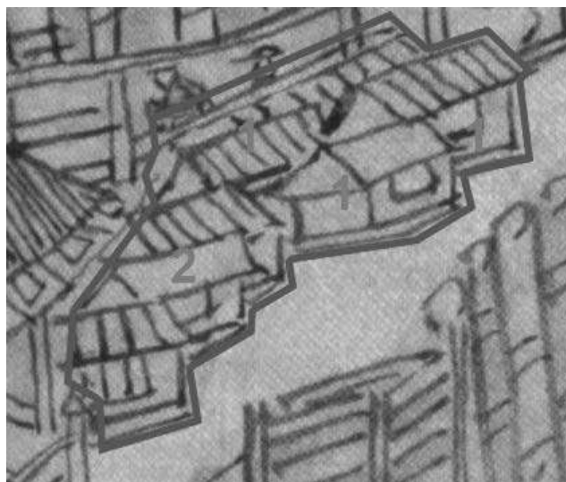
Рис. 10. Фрагмент рисунка «Luosha» из рукописного атласа «Aihun, Luosha, Taiwan, NeiMenggutu» (艾渾, 羅刹, 台灣, 蒙古圖) с выделенными строениями, которые можно отнести к строениям гостинного (торгового двора). 1 – отдельно стоящие амбары. 2 – изба ясачных целовальников.

Торговые ряды Колодозерского Богородице-Рождественского погоста в деревне Погост – единственное, что сохранилось от храмового комплекса. Композиционным центром были шатровая церковь Рождества Богородицы (1784 г.) и шатровая колокольня (XVIII в.), от деревни