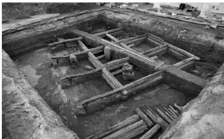
Рис.9 Археологические раскопки торговых рядов XVII века в Костроме