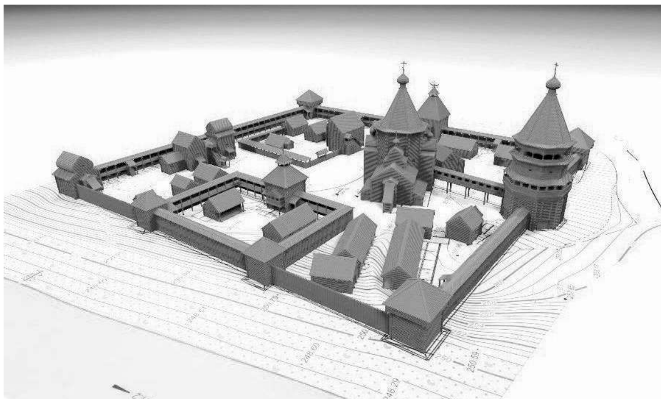
Рис. 12. 3D-модель Албазинского острога.