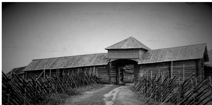
Рис. 7. Торговые ряды Колодозерского Богородице-Рождественского погоста в деревне Погост.

Служебные документы Албазинского острога сохранили сведения о наличии в остроге торговых лавок. Торговые лавки упоминаются в трех документах. Их точное местоположение не указано, но из «Отписки нерчинскому воеводе Ф.Д. Воейкову о неподчинении Ивана Войлочникова и его единомышленников вновь назначенному приказчику Шульгину» из-