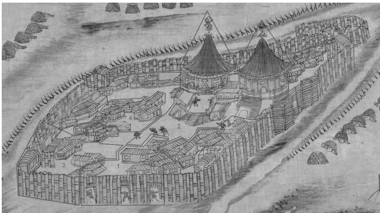
Рис. 11. Фрагмент рисунка «Luosha» из рукописного атласа «Aihun, Luosha, Taiwan, NeiMenggutu» (艾渾, 羅刹, 台灣, 蒙古圖) с выделенными группами строений. 1 – Малый острог, построенный Никифором Черниговским; 2 – Комплекс Воскресенской церкви и городская площадь; 3 – Воеводский двор со вспомогательными строениями; 4 – Строения приказной избы; 5 – Гостинный (торговый двор); 6 – Строения таможенного двора (ясачных целовальников).

Архитектурно-пространственная композиция памятника представляет собой прямоугольное в плане строение, состоящее из ряда рубленых клеток, Памятник представляет собой традиционные торговые ряды вблизи церковной терри-