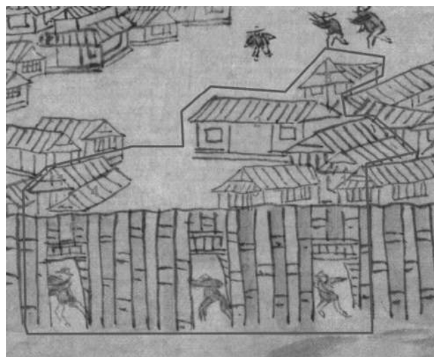
Рис.1.Фрагмент рисунка «Luosha» из рукописного атласа «Aihun, Luosha, Taiwan, NeiMenggutu» (艾渾, 羅刹, 台灣, 蒙古圖) с выделенными строениями, которые можно отнести к Албазинскому острогу, построенному Никифором Черниговским. 1 – Фрагмент стены острога, крытой тесом, 2, 3 – проездная Спасская башня, с надстроенной часовней, 4 – житница, 5 – амбар, 6-6 – участок крепостной стены с глухими башнями.

Расширение Албазинского острога началось