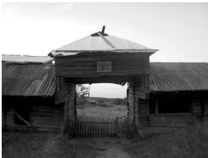
Рис. 8 Ворота и лавки торговых рядов Колодозерского Богородице-Рождественского погоста в деревне Погост.