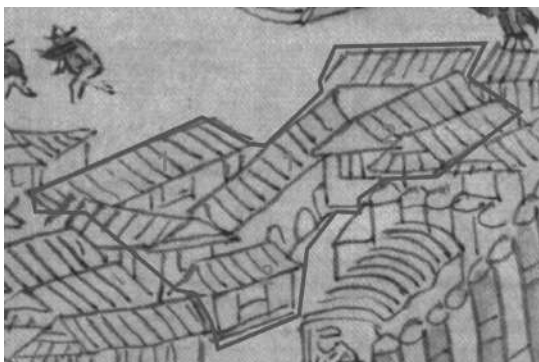
Рис. 6 Фрагмент рисунка «Luosha» из рукописного атласа «Aihun, Luosha, Taiwan, NeiMenggutu»

(艾渾, 羅刹, 台灣, 蒙古圖) с выделенными строениями, которые можно отнести к строениям гостиного (торгового двора). 1 – торговые лавки. 2 – отдельно стоящие амбары.