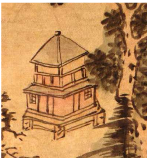
Илл. 3. Строение на рисунке «Luosha» [Aihun, 1697]). Предположительно колокольня Албазинского Спасского Монастыря.

(Library of Congress) в Вашингтоне. Этот источник является предметом систематического изучения одного из соавторов статьи [Трухин, 2015; Трухин, 2019]. Сооружение, изображённое на рисунке, имеет небольшой прямоугольный сруб в основании, над которым надстроена звонница с четырёхскатной шатровой кровлей. Какого-либо прируба к строению на рисунке не видно. Это строение по своей конструкции соответствует небольшой колокольне. Возможно, церковь Спасского монастыря была клетской с отдельно стоящей колокольней. Колокольня была более заметным сооружением, и художник изобразил на рисунке только её. Сопоставив наиболее характерные точки линии горизонта с их изображением на картографическом рисунке «Luosha», можно реконструировать предполагаемое местонахождение Спасской пустыни. Реконструкция допускает, что изображённая на рисунке колокольня располагалась на скальном выступе приблизительно в 2 км от северного вала острога, на окраине современного с. Албазино [Забияко, Черкасов, 2019, 171–172].