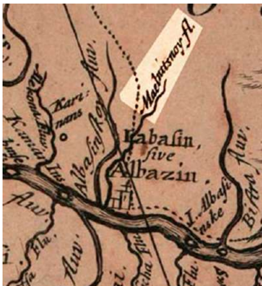
Илл. 2. Фрагмент карты Николаса Витсена с изображением реки мельничной в районе Албазинского острога [Nieuwe Lantkaart, 1687].

Единственным известным графическим источником, содержащем изображение строений Албазинского Спасского монастыря является картографический рисунок «Luosha» из рукописного атласа «Aihun, Luosha, Taiwan, Nei Menggu tu» (艾渾, 羅剎, 台灣, 蒙古圖) 1697 г., хранящегося в отделе географии и картографии (Geography & Map Division) библиотеки Конгресса США