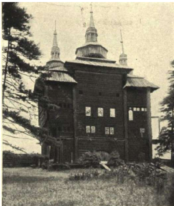
Ил. 1. Никольская церковь в Киренске [Серебренников 1915, рис. 4]

исследователей, о ней упоминал Н. А. Пономарев [Пономарев 2007], освещали в своих работах Е. Белых [Белых 2002, 20–21], И. В. Калинина [Калинина 1999, 36–40; Калинина 2000, 286–288]. В указанных статьях содержатся отсылки на дополнительные источники сведений о церкви. Прекрасное описание архитектуры церкви выполнено И. В. Калининой, что освобождает от необходимости проводить его заново (см.: [Калинина 2000, 288]).