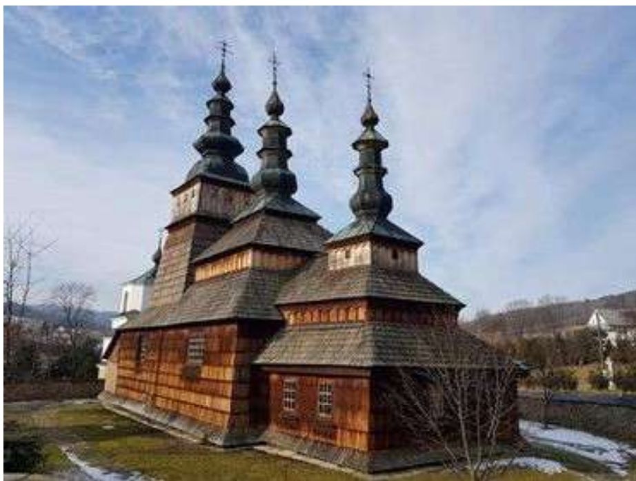
Ил. 5. Церковь в с. Овчары, Малопольское воеводство, Польша.

всемирного наследия ЮНЕСКО по разделу «Деревянные церкви Карпатского региона Польши и Украины» [List of UNESCO World Heritage Sites], имеет формы, весьма близкие к Киренской церкви. Ее характеризует ярусность, верхняя часть здания вершена сочетанием небольших куполов на восьмериках и пикоподобными главками, крыши имеют переломы, которые также можно найти у других готических церквей Карпат.