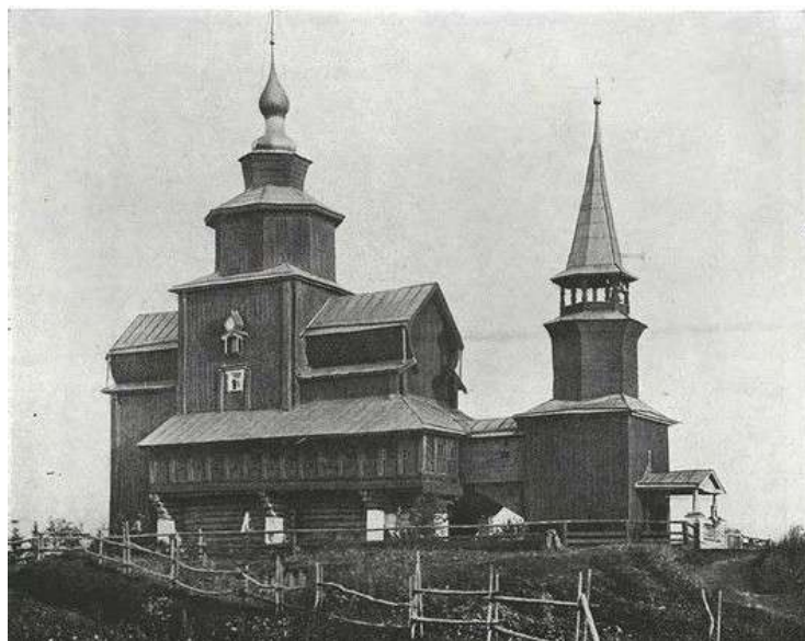
Ил. 3. Церковь Иоанна Богослова на Ишне [Забелло и др. 1942, рис. 360]