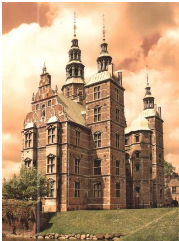
Ил. 4. Замок Розенбург, г. Копенгаген, Дания. Фото Е. А. Коваленко, 2009 г.

В XVIII веке возводятся сибирские оборонительные линии, имевшие явные признаки использования опыта военного инженера Себастьяна де Вобана и участия немецких фортификаторов [Шемелина 2011; Шемелина 2015]. В архитектуре Сибири ощущается очевидный интерес к принципам европейской фортификации, возможно, повлиявший на выбор образного языка церкви, формы и конструктивные элементы которой повторяют их особенности.