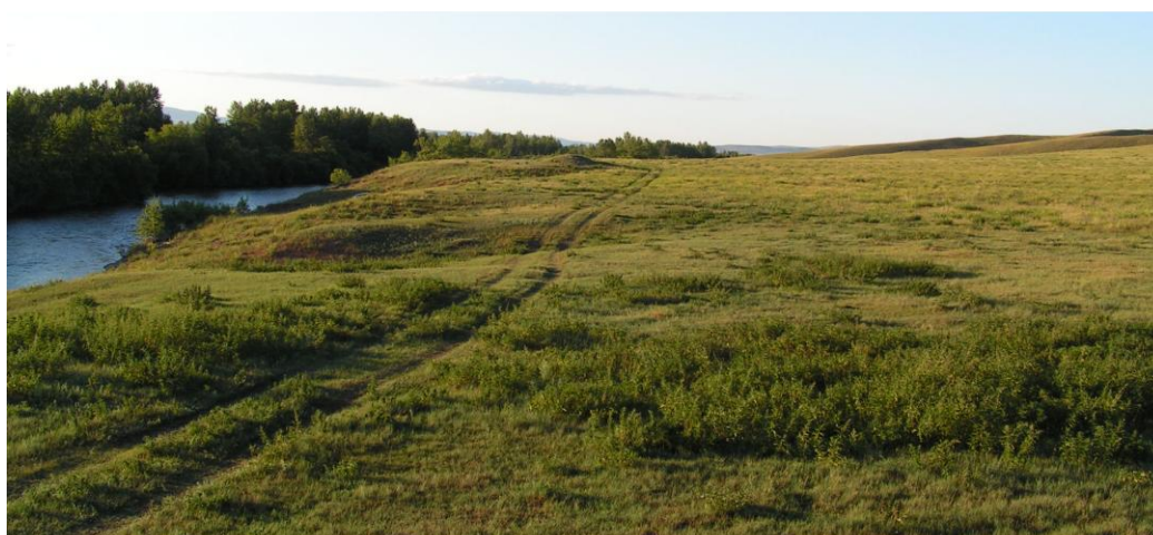
Рис. 4 (фото). Вид участка местности по правому берегу Белого Июса ниже д. Усть-Фыркал (снято с Ю)

Кроме изложенных выше обстоятельств, следует учитывать также и слишком малый для строительства в сердце владений кыргызов, с которыми здесь совсем недавно не могли справиться намного более внушительные русские воинские силы, состав отряда Тухачевского – всего 42 человека.