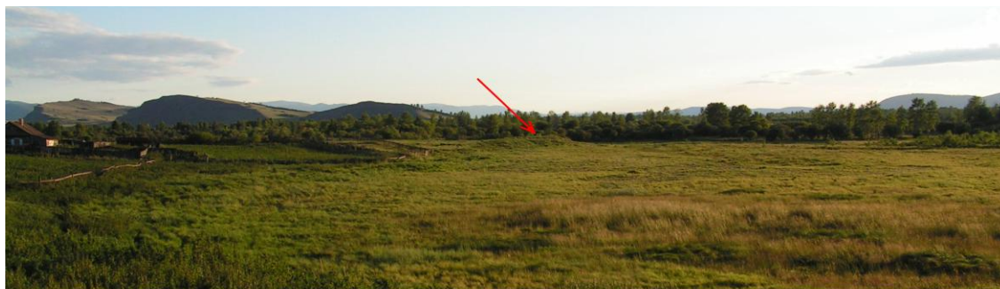
Рис. 2 (фото). Мысовая часть террасы, на которой находится д. Усть-Фыркал (снято с С)

Сама поверхность террасы в месте расположения современной деревни (фактически это западный скат горы) имеет сильный покат в сторону Фыркалки (рис. 3), в связи с чем строительство острога здесь было бы затруднено из-за невозможности надолго сохранить от разрушения его рвы, которые быстро подвергались размыванию дождевыми и тальными водами, стекающими по обширному склону горы в сторону реки. В настоящее время здесь уже фиксируется несколько глубоких промоин, видимо, образовавшихся из-за размывов кюветов полевых дорог; соответственно, необходимость рытья для острога рвов вызвала бы появление искусственных длинных углублений с неизбежно значительным перепадом высот, куда вода, как из водосборника, поступала бы из обращенного в сторону горы восточного рва, затем попадала в остальные рвы и с западных концов северного и южного рвов переливалась за их края, постепенно размывая и соседние участки вала.